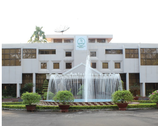
Cty CP Cao Su Bà Rịa