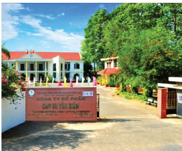
Cty CP Cao Su Tân Biên