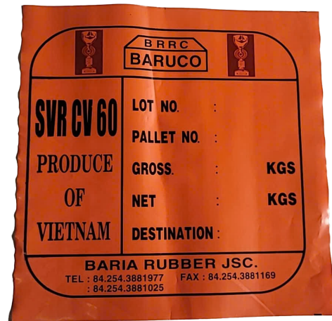
Tem pallet các loại