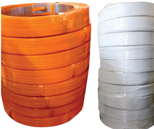
Tem cuộn PE các loại