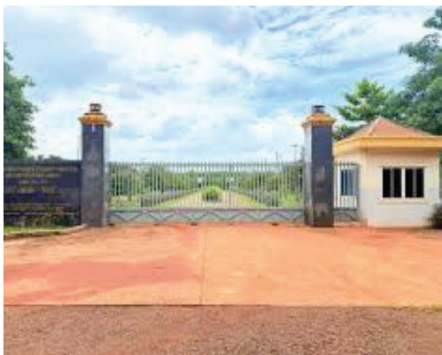
Cty CP Cao Su Lộc Ninh